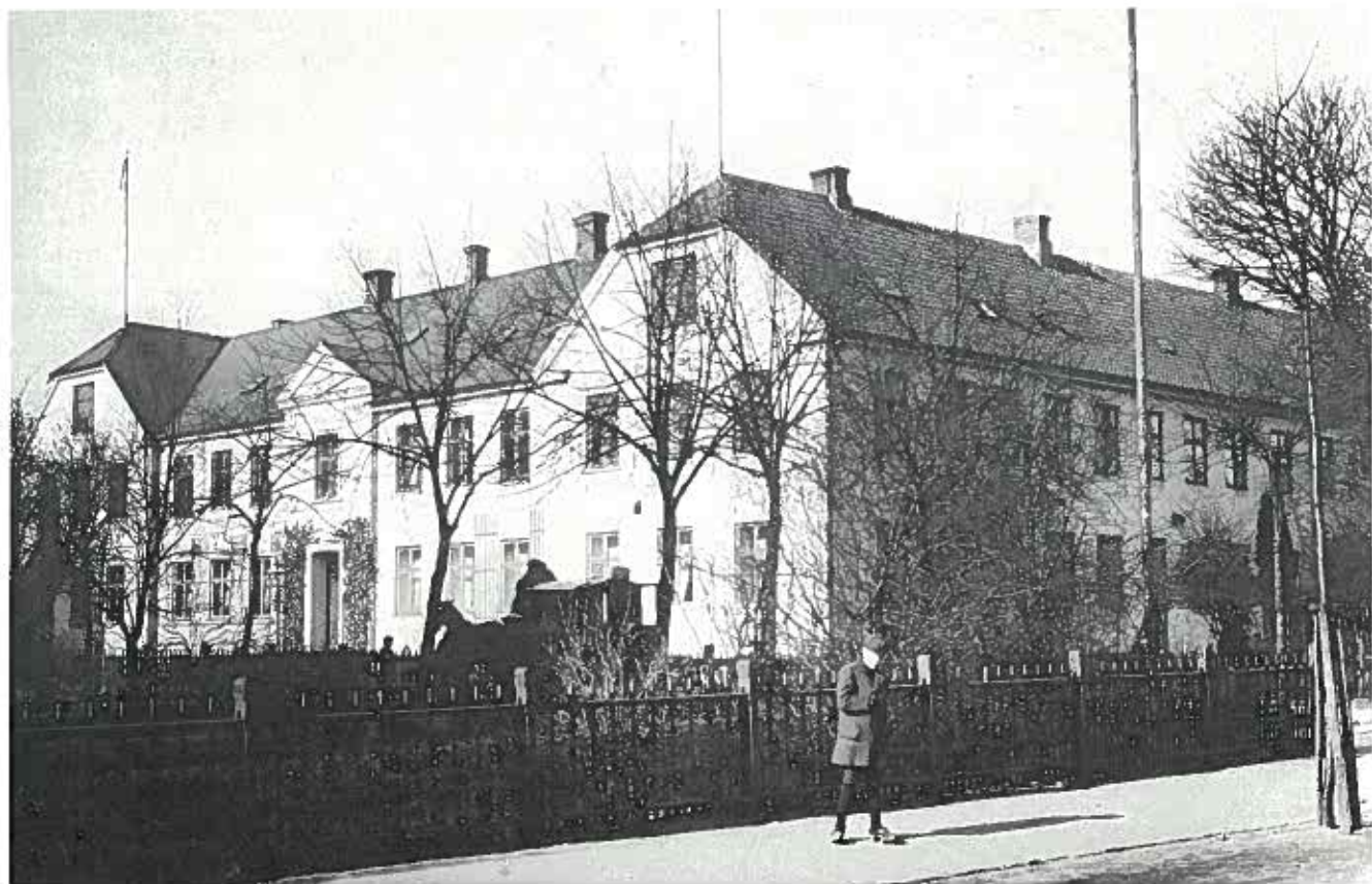
Fattiggården i Vindegade, set fra Klostervej omkring 1912. Tre år senere flyttedes fattiggården til sygehusbygningerne i Albanigade. (Herluf Lykke fot., Møntergården).

fejede Flakhaven, Albanitorv og tilstødende gader rene med lange koste af birkeris. De var iført blå bukser, træsko og stribet bluse.