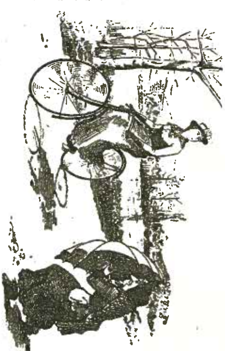
Uha, hvor forargeligt! — Den høje „Bicyklet“ fortvængtes i Løbet af 1880'erne og 90'erne af „Safety-Cyklen“ eller „Bicykletten“ med to lige store Hjul og med Kæderværk

DER FINDES i vore Dage præsenterede sig for enhver, der næppe nogen dansk Turistbrochure, som ikke bl. a. dem. Skamløs og stolt som en Amazoner lod den hulde Donna af en dansk Cyklepigge — og sig bare mærstre og fortsatte uden videre Farten. — Vi spør: Er dette den næste Formtid kun smaa 50 Aar siden, at mange gode Borgere i alle Lande forenede sig i Forargelse ustrøffet tillade sig saaledes at